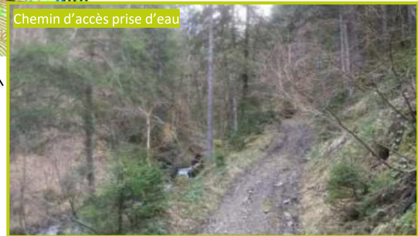
Chemin d'accès prise d'eau