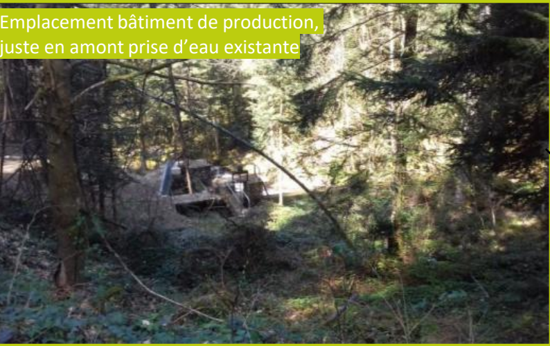
Emplacement bâtiment de production, juste en amont prise d'eau existante