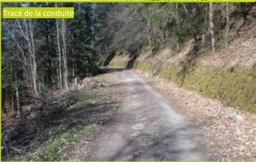
Tracé de la conduite