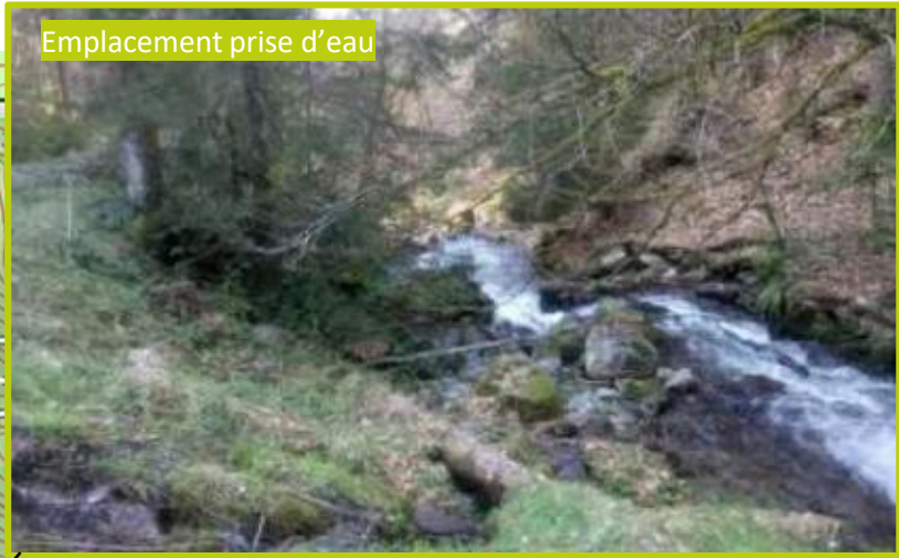
Emplacement prise d'eau